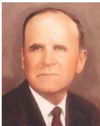
William Marrion Branham